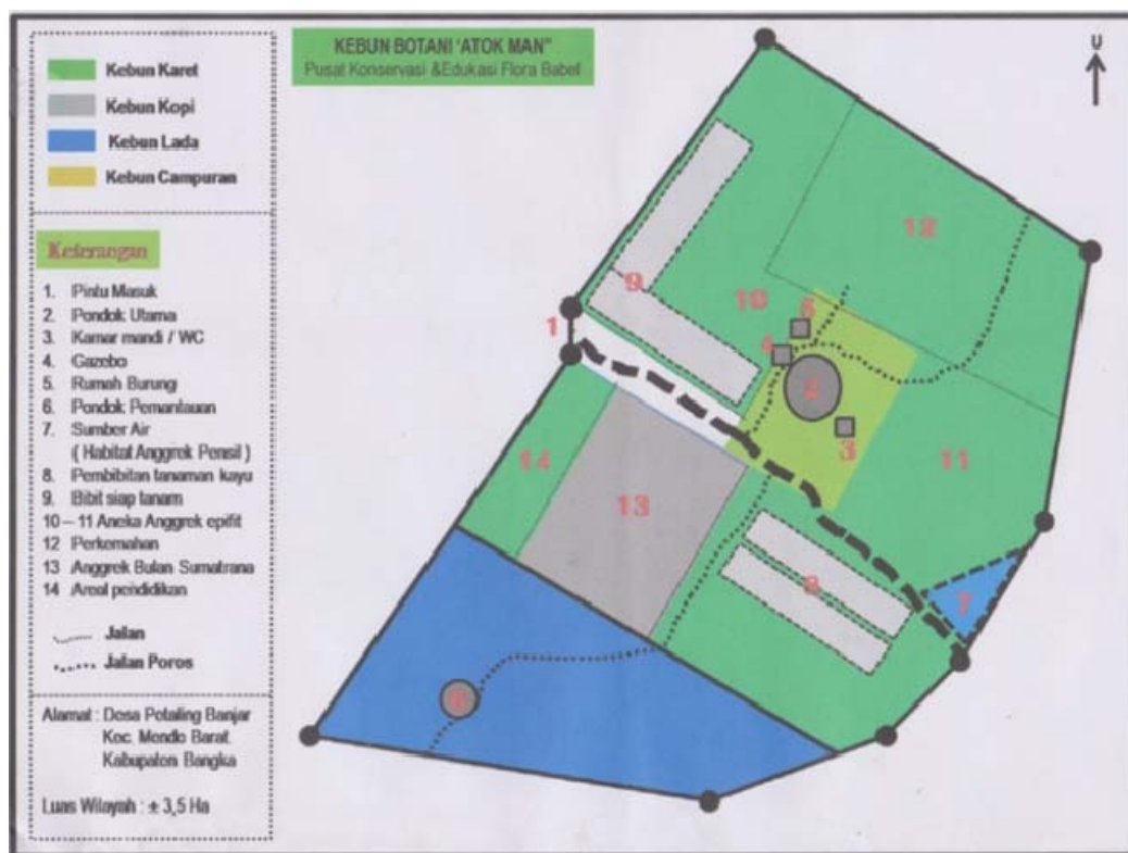
Gambar 1. Denah Kebun Botani

Penelitian dilakukan di kawasan Kebun Botani Bangka Flora Society (KBBFS) yang terletak di dusun Kampung Sawah desa Petaling Banjar, kecamatan Mendo Barat, Kabupaten Bangka dengan luas lahan \pm 3,5 ha. Kebun ini memiliki ketinggian 43,38 m dpl dan secara geografis lokasi penelitian terletak pada koordinat 02^{\circ}08' 552'' LS dan 105^{\circ} 58' 018'' BT. Lokasi penelitian merupakan perkebunan karet, tanaman buah-buahan dan tanaman lokal Bangka. Denah kebun Botani terdapat pada Gambar 1.