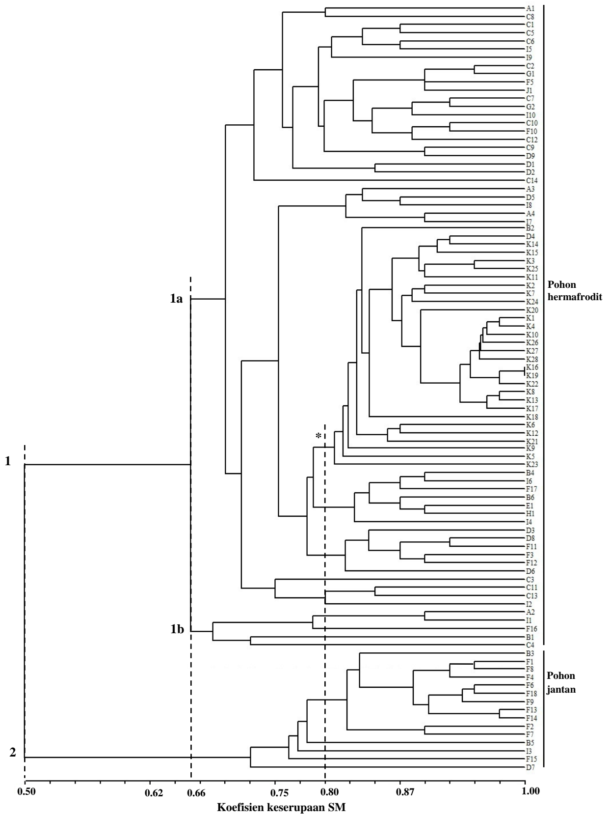
Gambar 2. Dendrogram kapulasan berdasarkan karakter morfologi vegetatif dan generatif yang dibangun dengan indeks keserupaan simple matching dan metode UPGMA. A. Bogor Barat, B. Bogor Utara, C. Bogor Selatan, D. Babakan Madang, E. Cibinong, F. Cileungsi, G. Ciomas, H. Parung, I. Sukaraja, J. Cibadak, K. Bawen.